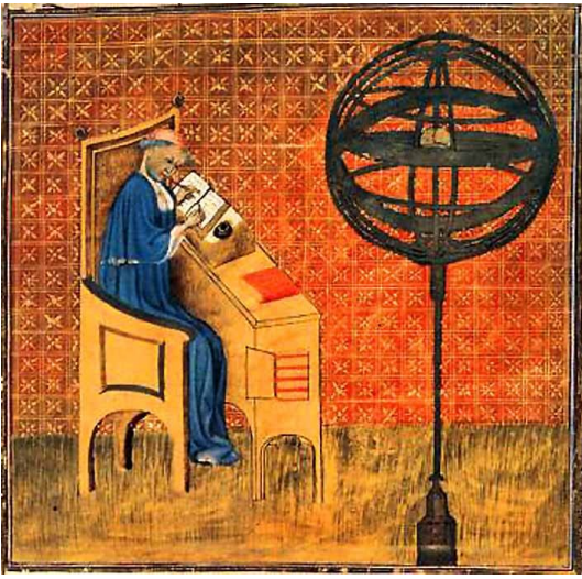
Portrait de Nicole Oresme (ca. 1320 - 1382): Miniature issue de Nicole Oresme Traité de l'esperre , Paris, Bibliothèque Nationale, fonds français 565, f. 1r.

Les Questions sur les Météorologiques représentent le seul texte majeur de Nicole Oresme à ne pas encore avoir fait l'objet d'une édition, ni à l'époque contemporaine ni avant. Ce texte constitue, très vraisemblablement, le premier ouvrage qui a été rédigé par le Maître parisien et représente donc un texte extrêmement important pour la reconstruction de son parcours philosophique. Il existe deux rédactions, autonomes et fort différentes, de ce texte, toutes les deux remontant aux premières années de la carrière philosophique de Nicole Oresme.