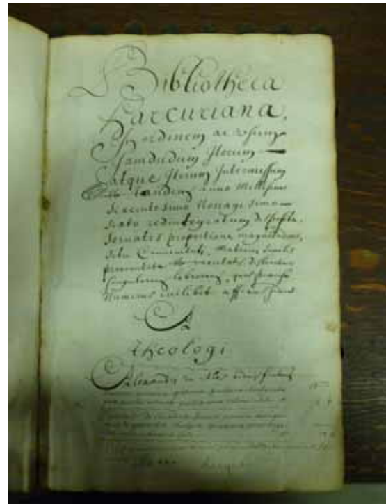
Catalogue de la bibliothèque du collège d'Harcourt de Paris, 1696 (Arch. Nat., MM//453, 282 p.)